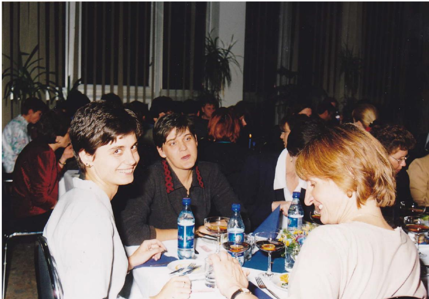
X. PDNL, 7.11. - 9.11.2001, Piešťany