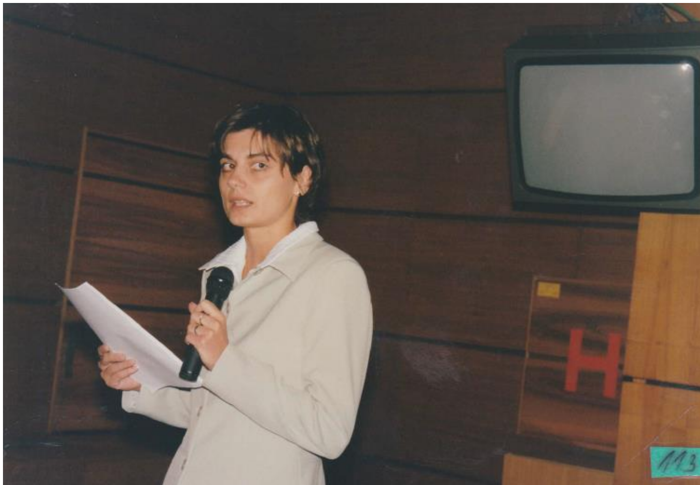
XI. PDNL 20.-22.11.2002, ÚVS, Bratislava