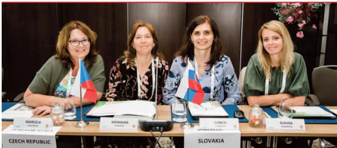
Česká a slovenské delegátky Valného zhromaždenia EAHP.