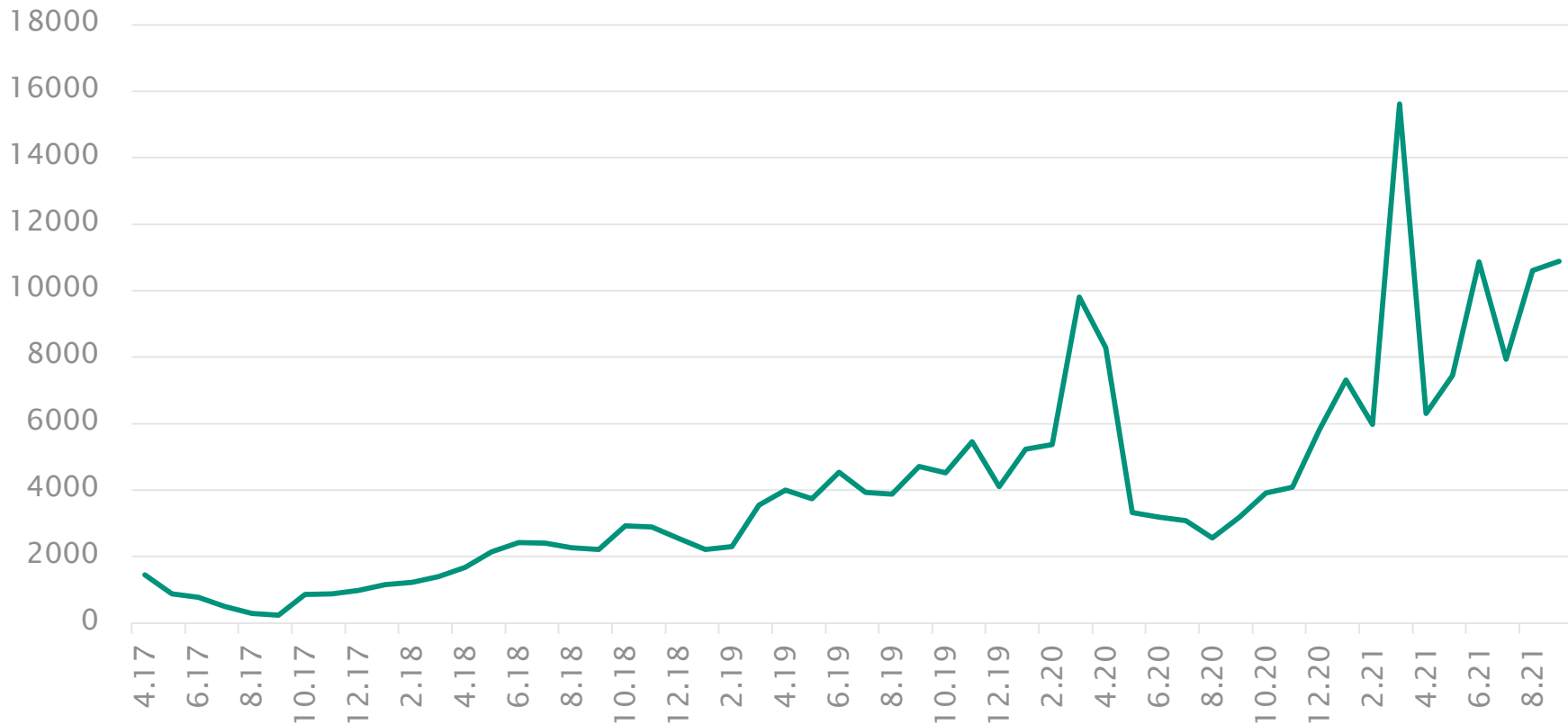
ISEDO všetky lekárne (počet objednávek)